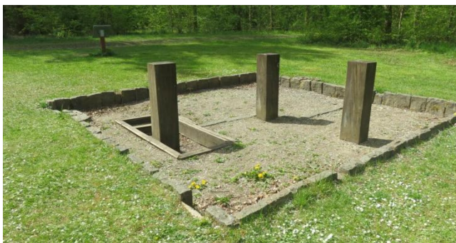
Ole Rømers Landobservatorium