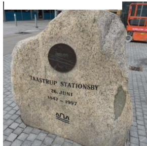
Figur 10 + spørgsmål b