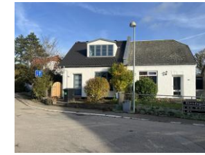
Klovtoftegade dobbelthuset 26/24 og 22/20

Undervejs blev tre af de gamle dobbelthuse revet ned. Det eneste hus, der kan trække rødder tilbage til de oprindelige huse, er Klovtoftegade 4 , der står registreret som bygget i 1902. Klovtoftegade 2 står derimod registreret som bygget i 1918, mens Klovtoftegade 6 står registreret som bygget i 1925. Det fjerde dobbelthus er helt væk i dag.