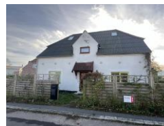
Klovtoftegade 6 fra 1925, nr. 4 fra 1902 og nr. 2 fra 1918