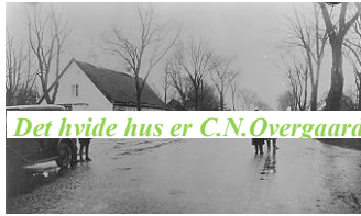
Det hvide hus er C.N. Overgaards