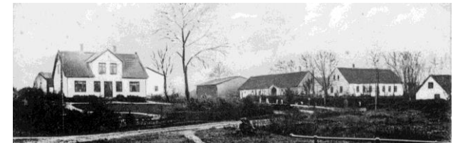
Højgård og Rugkærgård , foto ca. 1910

jord til rækkehusbebyggelsen Søndertoften .