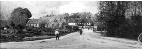
De to huse set fra Blåkildegård før og nu.

Det gule nabohus med murstensmønster (Skolevej 50) rummede ligeledes tre familier.