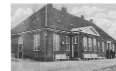
Bemærk, at der endnu ikke er gravet ud til viadukten.

I 1917 fik Hedehusene sin tredje station. Det er den bygning, der ligger her i dag. I stueplan var der dengang billetkontor, bagageekspedition og