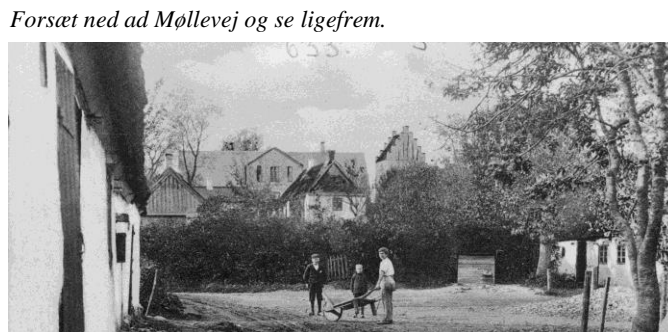
Tre drenge leger på Møllevej. I baggrunden ses Fløng Skole fra 1898 og Fløng Kirke, Foto fra ca. 1900.

17. Huset på hjørnet af Møllevej/Nørrekær ( Nørrekær 1 ), er et af Fløngs gamle jordløse huse. En skomager boede omkring år 1900 i dette smukke stråtekt hvide hus med sort bindingsværk. Bag huset lå tidligere det gadekær, der har givet gaden navn. Forsæt op ad Nørrekær.