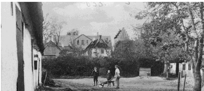
Tre drenge leger på Møllevej. I baggrunden ses Fløng Skole fra 1898 og Fløng Kirke, Foto fra ca. 1900.

Førhen lå den femte af Fløngs gamle gårde, Refmosegård/-matrikel 6 , hvor der siden 1974 har ligget en børneinstitution, der har navn efter gården. Refmosegård var førhen en af de mindre gårde, idet dens ejer allerede i midten af 1800-tallet fraskødde en del af dens jord. Forsæt ned ad Møllevej og se ligefrem.